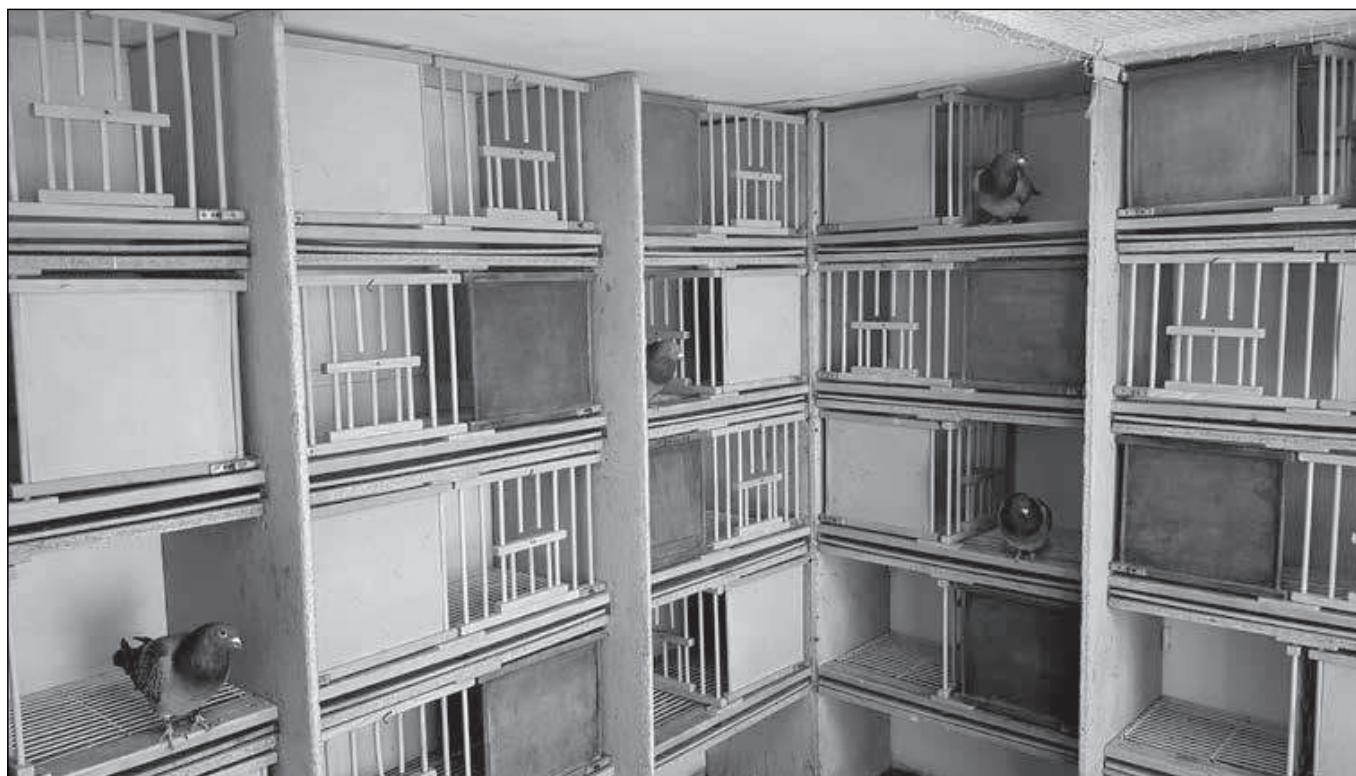
Oddělení klasických vdovců